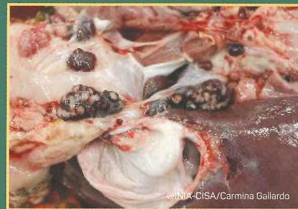
Krvavi limfni čvorovi