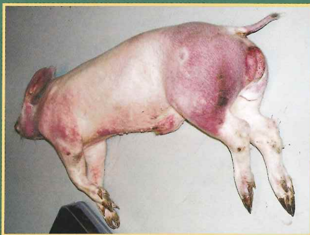
Krvavi proljev i crvenilo na koži vrata, grudi i nogu

ASK se manifestira različitim kliničkim znakovima. Zaražene, bolesne svinje uglavnom ugibaju. Obično se javlja gubitak apetita, ležanje i nevoljkost, a svinje brzo i iznenada uginu. Rijetko se pojavljuju drugi klinički znakovi: potištenost, gubitak tjelesne težine, krvarenja na koži (vrhovi uški, rep, noge, grudna i trbušna regija), otežano kretanje i pobačaji krmača. Klinički znakovi se teže uočavaju u divljih svinja.