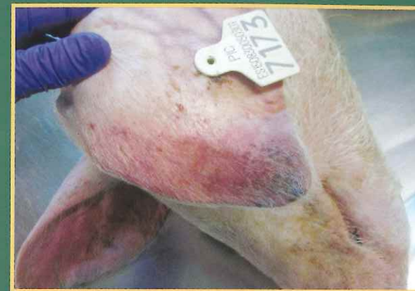
Cijanoza – plavo ljubičasta boja na vrhovima uški